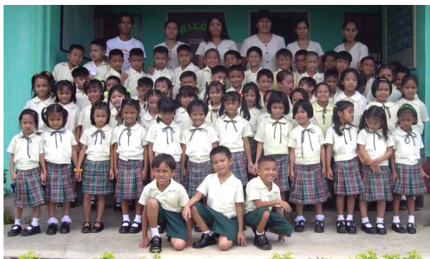
Alle leerlingen uit klas 1 en 2 samen met medewerkers

Op 14 juni is het nieuwe schooljaar begonnen en stroomden 18 jongetjes en 12 meisjes nieuw in. Van hen komen 25 kinderen van de Payatas vuilnisbelt en 5 van de wijk rondom de school.