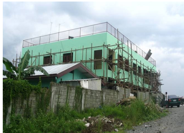
De nieuwbouw met op de voorgrond een stukje dak van de 'oude' gebouwen.

In februari konden we, mede dankzij een verdubbelingsactie van Edukans (zie: www.edukans.nl ), aan de al eerder aangekondigde nieuwbouw beginnen. Ondanks een kleine tegenslag loopt de verbouwing heel goed en op dit moment wordt er de laatste hand aan gelegd. De tegenslag betrof een maatregel van de brandweer; de gangen moesten anders worden dan op de oorspronkelijke tekening stond. Toen de muren eenmaal stonden, bleken de lokalen qua ruimte onder de verandering te hebben geleden. Er is vervolgens een aanpassing gemaakt in de indeling, maar dat bracht helaas wel wat extra kosten met zich mee.