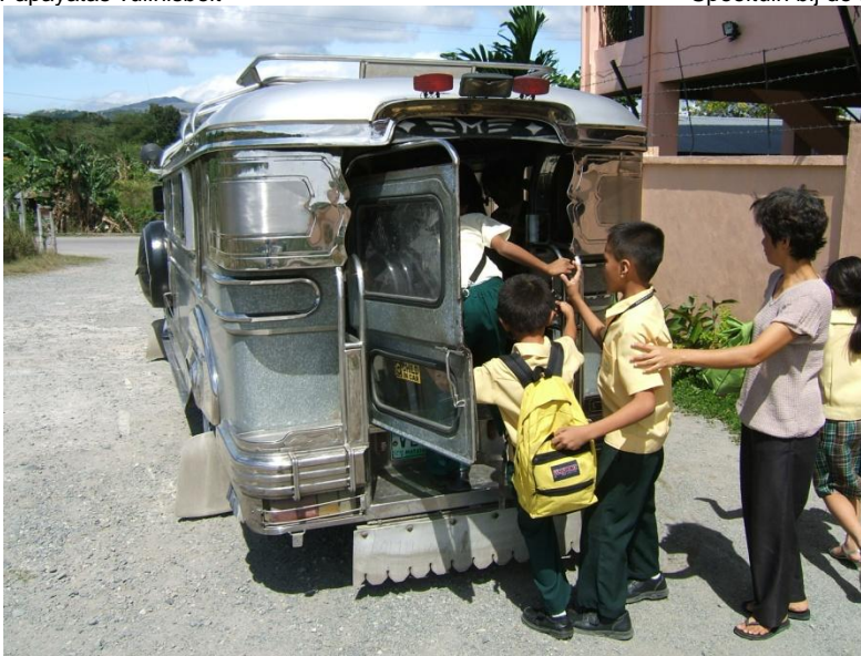
Busje waarmee leerlingen worden opgehaald