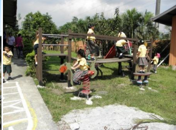
Speeltuin bij de school